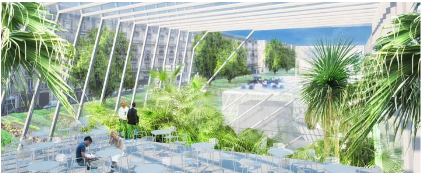
Manuelle Gautrand Architecture