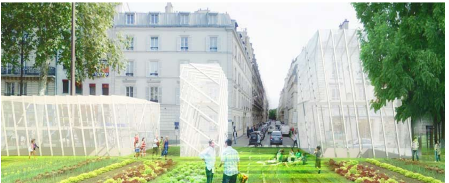
Manuelle Gautrand Architecture