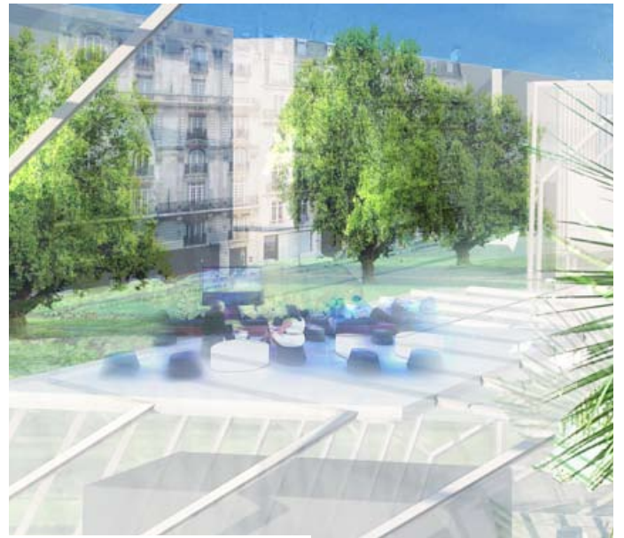
Manuelle Gautrand Architecture