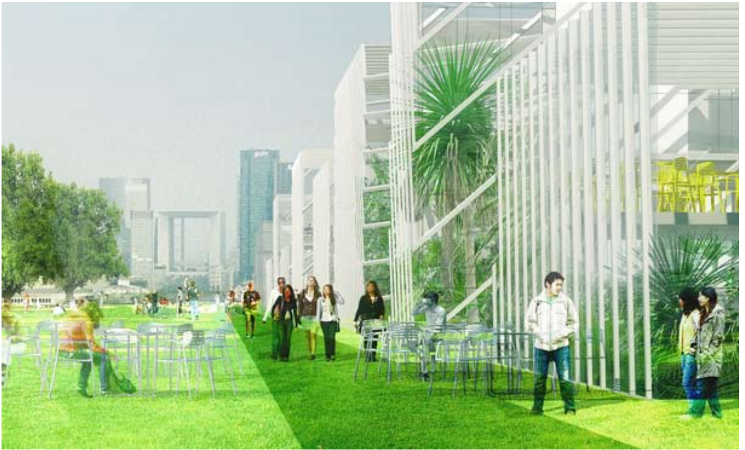
Manuelle Gautrand Architecture